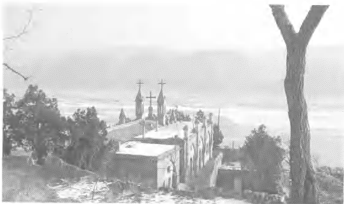
图5 佳县谭家坪天主教堂屋面