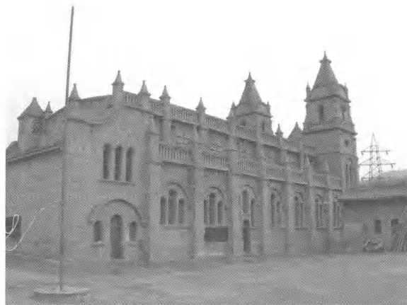
图2 延安桥儿沟天主教堂侧立面