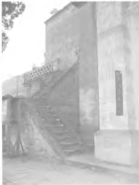
图6 佳县谭家坪天主教堂入口