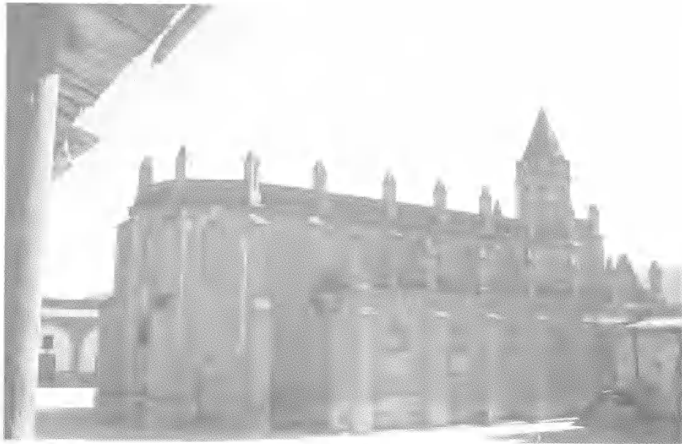
图3 延安甘谷驿天主教堂侧立面