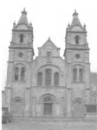
图1 延安桥儿沟天主教堂入口

(1)教堂以点状分布为主,且各县分布极不平衡。其中63%集中在延安府(靖边、定边),21%集中在榆林府(怀远县、榆林、佳县)。