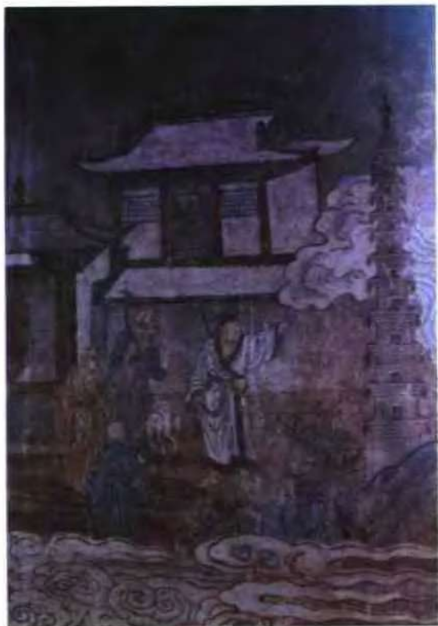
吕洞宾游寒山寺 (元) 山西省芮城县永乐宫