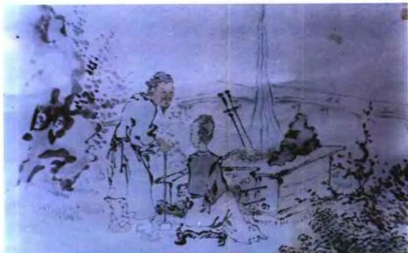
干将莫邪炼剑图 (清) 静虚道人 作