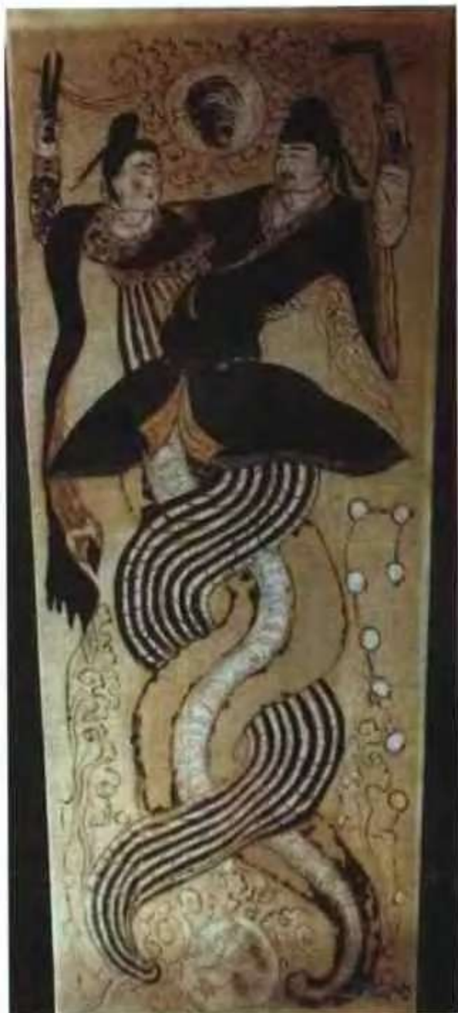
伏羲女娲图 (唐) 新疆吐鲁番出土