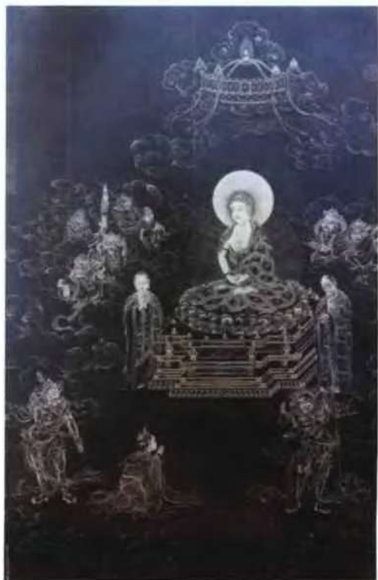
无量寿佛图轴 (清) 丁观鹏 作