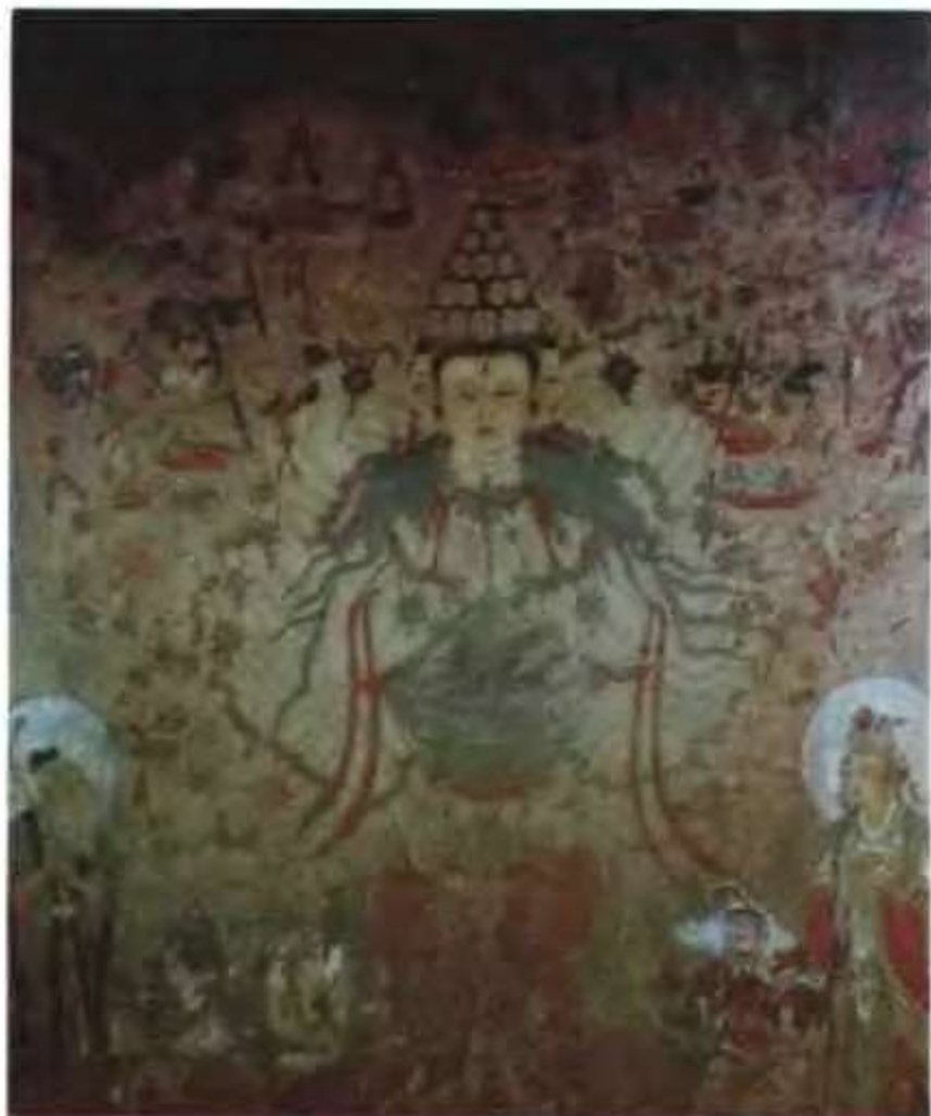
千手千眼观音 (金) 山西省朔阳县崇福寺