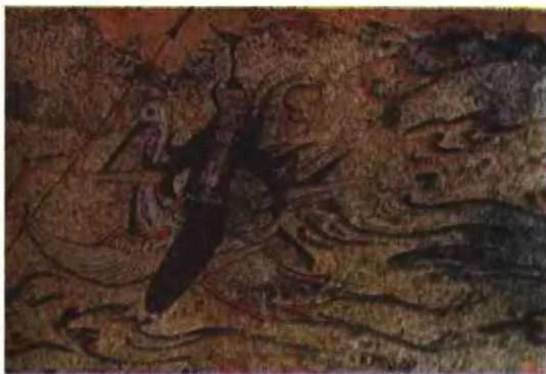
骑鹤仙人 高句丽壁画