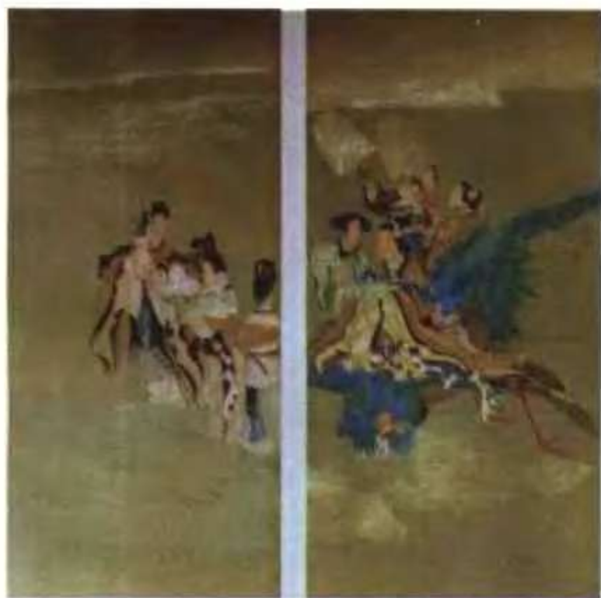
群仙祝寿图 (局部) (清)任伯年 作