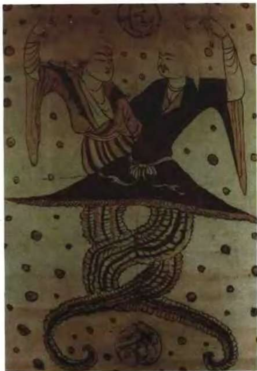
伏羲女娲图 (唐) 新疆吐鲁番出土